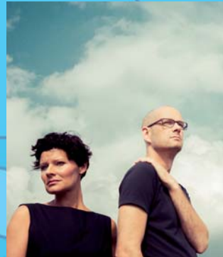
JAZZNIGHT: LE BANG BANG

JAZZNIGHT 15 € /erm. 12 € Drei Bands stellen sich vor